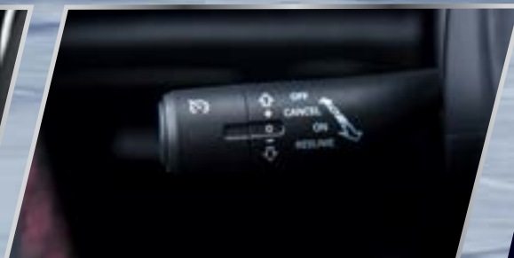
Cruise control (Ga tự động)