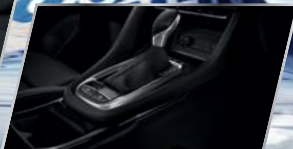
Hộp số CVT già lập 8 cấp