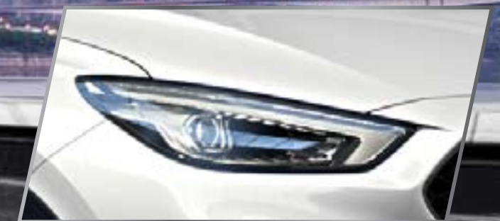
Đèn pha FULL LED /