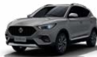
Màu Bạc /