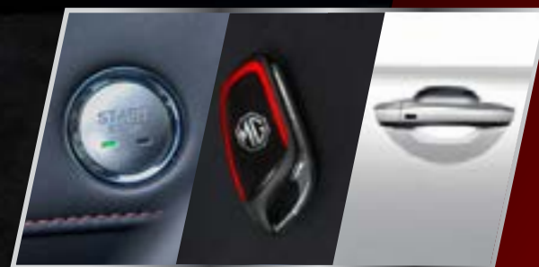
Nút khởi động Start/Stop & Chìa khóa thông minh /