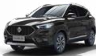
Màu Đen /