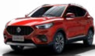
Màu Đỏ /