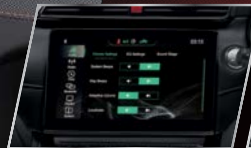
Màn hình cảm ứng 10.1" /

Các chi tiết trong khoang nội thất của MG ZS MỚI được thiết kế cách tân và chế tạo tỉ mỉ với các chi tiết mạ kim loại. Mọi chi tiết trên xe đều thể hiện tính thể thao sang trọng, từ bảng điều khiển được trang trí đặc biệt bằng vật liệu mềm cho đến MÀN HÌNH CẢM ỨNG 10.1". Bạn sẽ thoải mái tận hưởng mọi hành trình với ghế lái chỉnh điện 6 hướng. Cửa sổ trời toàn cảnh diện tích 1.19m 2 , diện tích mở tối đa lên đến 0.49m 2 với 7 chế độ mở. Bạn sẽ có những trải nghiệm hoàn toàn mới trên mọi hành trình và khám phá thế giới theo một cách hoàn toàn khác biệt.