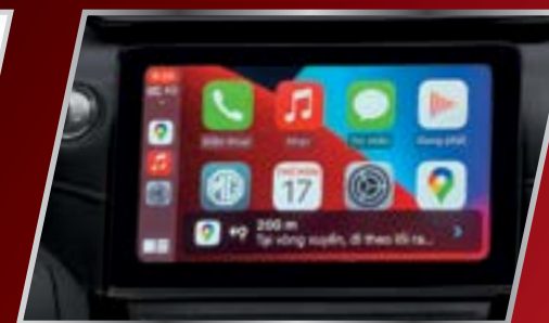
Màn hình cảm ứng 10.1" đa chức năng kết nối Apple CarPlay và Android Auto /