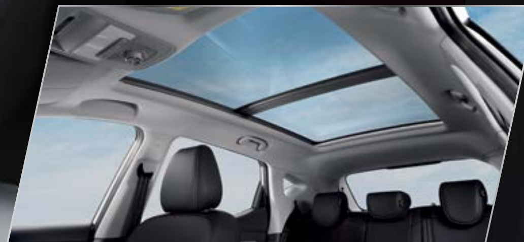
Cửa sổ trời toàn cảnh với 7 chế độ mở /