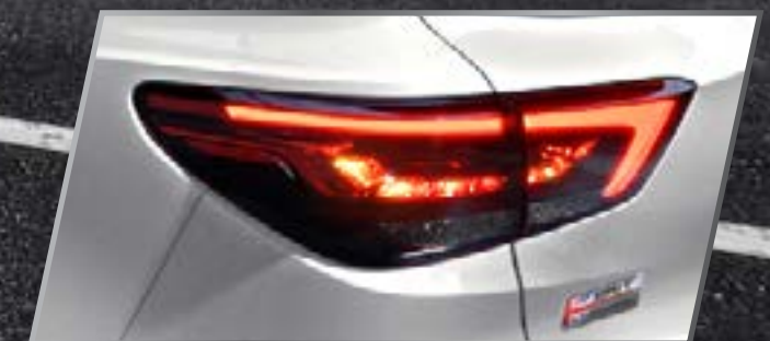
Đèn hậu LED /