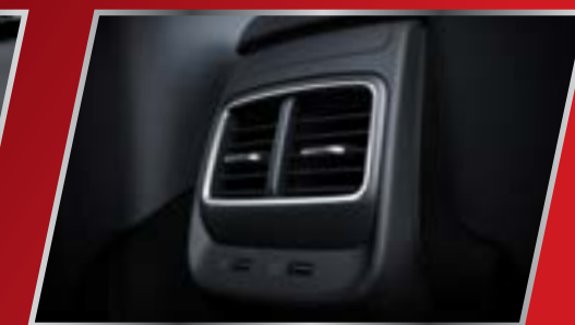
Cửa gió điều hòa hàng ghế sau /