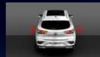
Hệ thống ĐÈN BÁO PHANH KHẨN CẤP - HAZ