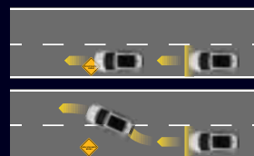
Hệ thống chống bó cứng phanh ABS Hệ thống hỗ trợ lực phanh EBA Hệ thống phân phối lực phanh điện tử EBD