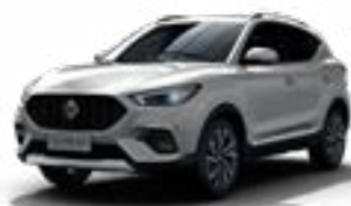
Màu Trắng /