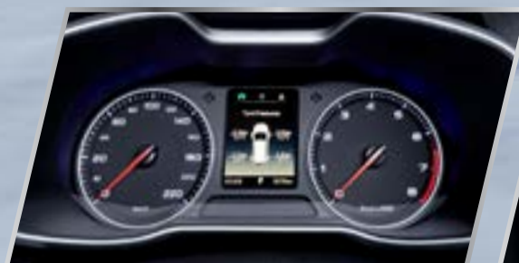
Kiểm soát áp suất lốp trực tiếp

Khi xe khởi hành lại sau khi dừng trên dốc, hệ thống sẽ tự động điều khiển phanh trong khoảng 2 giây để tránh xe bị trượt để tăng cường an toàn cho lái xe trong khi khởi hành.