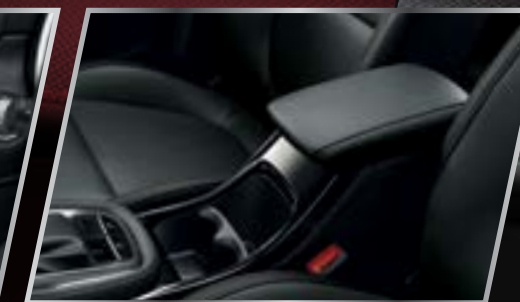
Bộ tỳ tay /