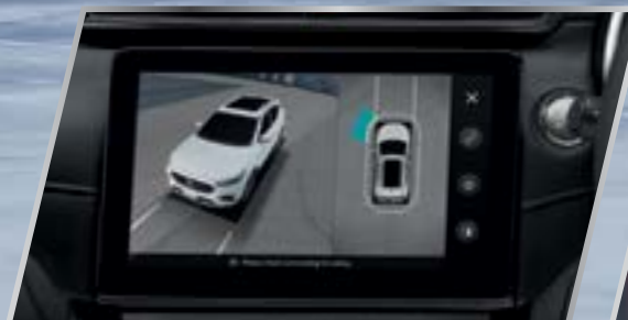
Camera 360° hiển thị 3D