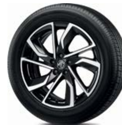
Mâm xe hợp kim nhôm 17"