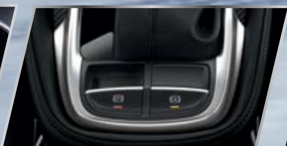
Phanh tay điện tử & giữ phanh tự động