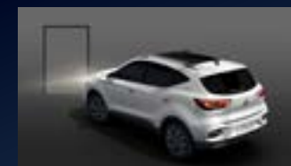
ĐÈN DẪN ĐƯỜNG - FOLLOW ME HOME