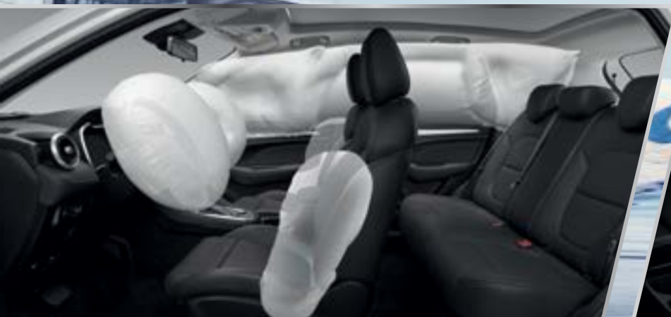
Hệ thống 6 túi khí