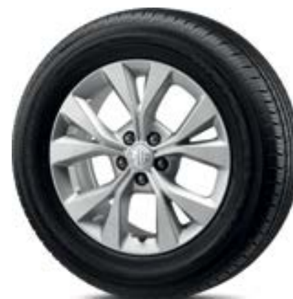
Mâm xe hợp kim nhôm 16"