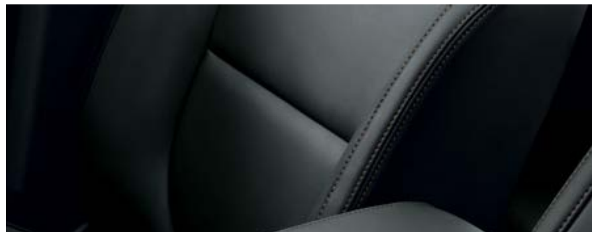
Màu Đen /