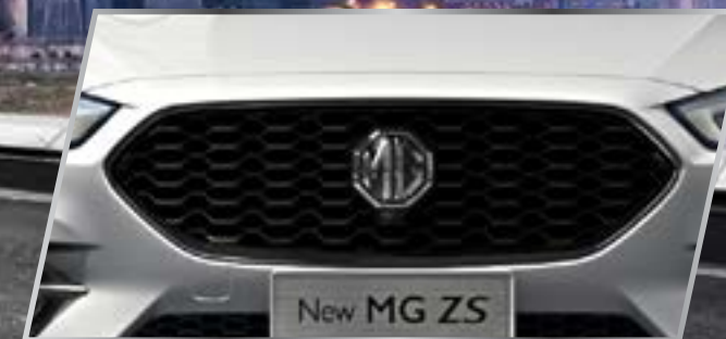
Lưới tản nhiệt thể thao /

MG ZS MỚI nổi bật trên mọi cung đường với lưới tản nhiệt phía trước được cách tân và những đường nét thiết kế mang phong cách Anh Quốc độc đáo. Thiết kế được nâng tầm với đèn pha tự động kết hợp với dải LED ban ngày bắt mắt. Đèn hậu mới cũng được cải tiến về mặt thiết kế, bộ mâm hợp kim 17" với thiết kế thể thao cũng làm tăng thêm vẻ sang trọng cho chiếc xe. MG ZS mới đang làm thay đổi định nghĩa về Thiết kế thông minh - thiết kế đáp ứng được mọi nhu cầu của cuộc sống hiện đại.