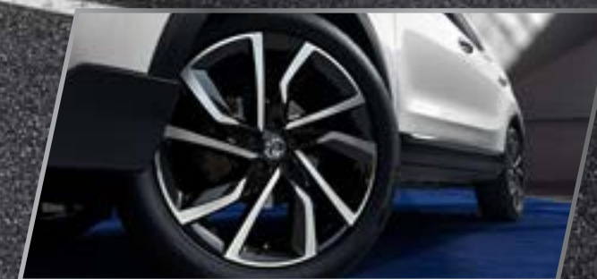
Mâm xe 17" /