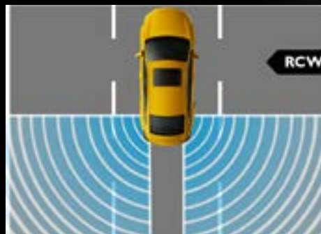
HỆ THỐNG CẢNH BÁO PHƯƠNG TIỆN VA CHẠM TỪ PHÍA SAU (RCW) *