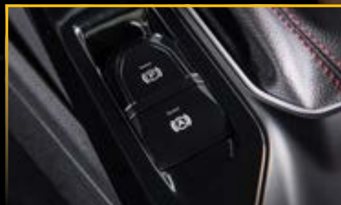
PHANH TAY ĐIỆN TỬ (E-PKB) & GIỮ PHANH TỰ ĐỘNG (AVH)