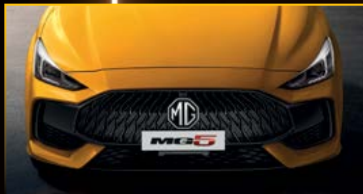
LƯỚI TẢN NHIỆT KỸ THUẬT SỐ THIẾT KẾ HÌNH NGỌN LỬA