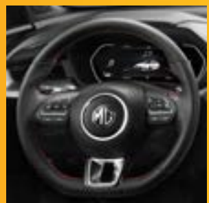
VÔ LĂNG 3 CHẾ ĐỘ LÁI