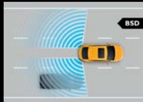
HỆ THỐNG CẢNH BÁO ĐIỂM MÙ (BSD) *

AN TOÀN VƯỢT MONG ĐỢI với hệ thống bảo vệ đồng bộ của MG, hệ thống an toàn với công nghệ từ châu Âu được tích hợp các tính năng như Cảnh báo điểm mù, Hệ thống hỗ trợ chuyển làn, Cảnh báo phương tiện cắt ngang phía sau, Cảnh báo phương tiện va chạm từ phía sau, Hệ thống làm khô phanh đĩa, Hệ thống treo trước MacPherson và treo sau thanh giằng xoắn giúp tăng độ cứng, mang lại sự an toàn chắc chắn. Bên cạnh đó, MG5 được trang bị Hệ thống 6 túi khí an toàn và Camera 360 hiển thị 3D giúp bạn an tâm di chuyển trên mọi cung đường.