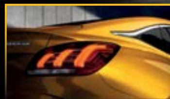
ĐÈN HẬU LED BÁT MẮT