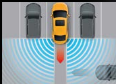
HỆ THỐNG CẢNH BÁO PHƯƠNG TIỆN CẮT NGANG PHÍA SAU (RCTA) *