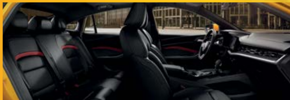
KHOANG NỘI THẤT RỘNG RÃI VỚI GHẾ LÁI THỂ THAO CHỈNH ĐIỆN 6 HƯỚNG *