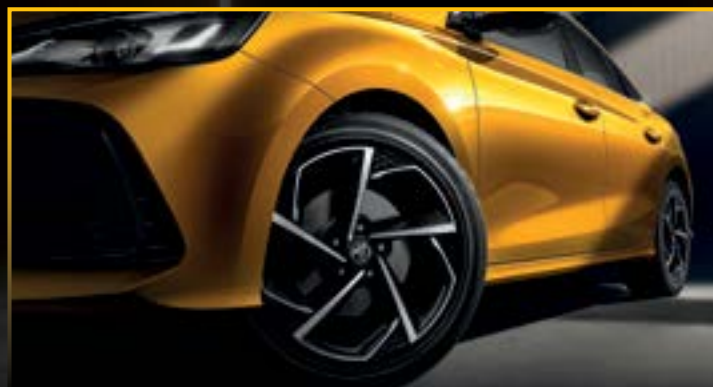
MÂM XE HỢP KIM 17" VỚI 2 TÔNG MÀU THIẾT KẾ MÔ PHỎNG LƯỚI RIU TOMAHAWK*