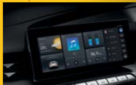
MÀN HÌNH CẢM ỨNG 10" KẾT NỐI APPLE CARPLAY VÀ ANDROID AUTO