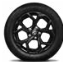
16" Bản 1.5L STD