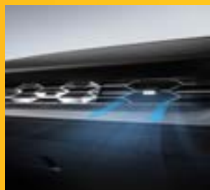
ĐIỀU HÒA KHÔNG KHÍ VỚI HỆ THỐNG LỌC BỤI MỊN PM2.5