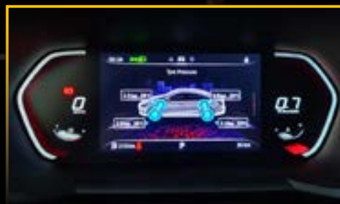
CẢM BIẾN ÁP SUẤT LỐP TRỰC TIẾP (TPMS)