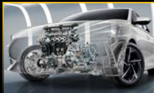
ĐỘNG CƠ 1.5L CVT 112HP, MÔ-MEN XOẮN CỰC ĐẠI 150NM

Khám phá trải nghiệm lái mới với động cơ 1.5L và hộp số vô cấp CVT sản sinh công suất cực đại 112Hp và Momen xoắn cực đại 150Nm. Kỹ thuật mới đã được cải tiến để tăng cường khoảng sáng gầm xe và kích thước thân xe, mang đến sức sống mạnh mẽ và phong cách thể thao cho chiếc MG5. Vô lăng 3 chế độ trợ lực lái và bảng điều khiển được thiết kế sao cho phù hợp nhất để người lái được trải nghiệm trọn vẹn cảm giác lái thể thao đích thực.