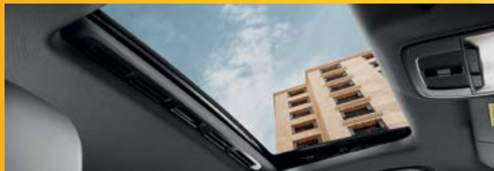
CỬA SỔ TRỜI VỚI 4 CHẾ ĐỘ ĐIỀU CHỈNH *