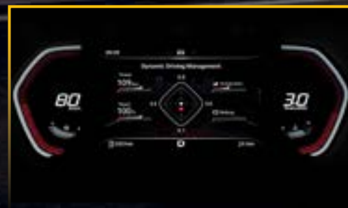
MÀN HÌNH ĐA THÔNG TIN HIỂN THỊ THÔNG SỐ VẬN HÀNH