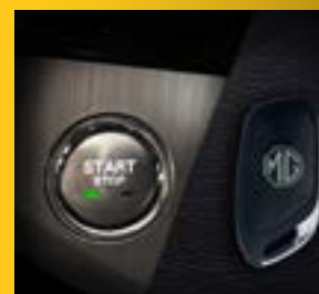
NÚT KHỞI ĐỘNG START/ STOP & CHÌA KHÓA THÔNG MINH