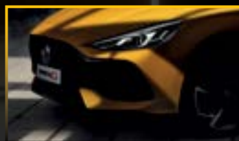
ĐÈN PHA LED TỰ ĐỘNG