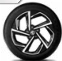
17" Bản 1.5L LUX