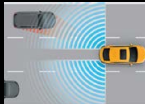
HỆ THỐNG HỖ TRỢ CHUYỂN LÀN (LCA) *