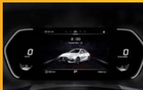
MÀN HÌNH ẢO 7" VIRTUAL COCKPIT *