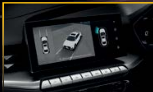
CAMERA 360° HIỂN THỊ 3D *